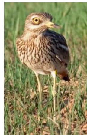
Un adulte d'œdicnème criard

Listes rouges des espèces menacées : Isère : En danger France : Vulnérable Europe : Quasi menacée