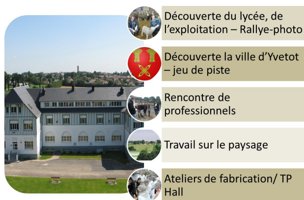
Activités pour les 2nde Pro PA et ABIL

À la fin du module d'accueil, les élèves, en petits groupes, font une restitution collective sur un thème, au choix, abordé au cours des activités qui leur sont proposées.