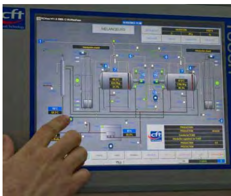
TABLEAU DES ÉPREUVES

Liste, nature, durée et coefficient des épreuves de l' examen de la série STAV du baccalauréat technologique